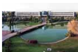
Universidad Europea de Madrid (UEM)