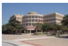
The University of California (IRVINE)