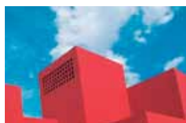
Santa Fe University of Art and Design