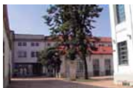
Nuova Accademia di Belle Arti Milano (NABA)