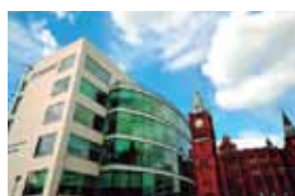
The University of Liverpool