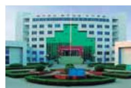
Sichuan Tianyi University