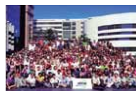
École Supérieure du Commerce Extérieur (ECSE)

Mais informações sobre os programas podem ser obtidas pelo telefone (51) 3230-3305 ou pelo e-mail international@uniritter.edu.br ou ainda pelo atendimento on-line, via MSN: international@uniritter.edu.br .